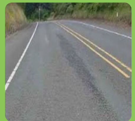
Evita el Desgranamiento y problemas comunes