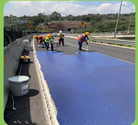
Carreteras/Calles de Asfalto y Concreto